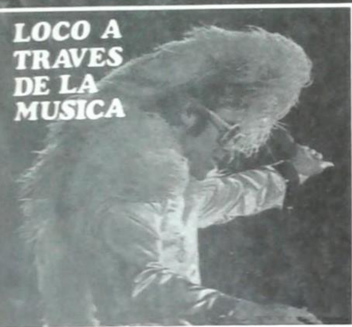
Una gran tendencia a lo teatral llevó a Elton como uno de los precursores de la música-entertainment de hoy, pero él, además, hace gran música.