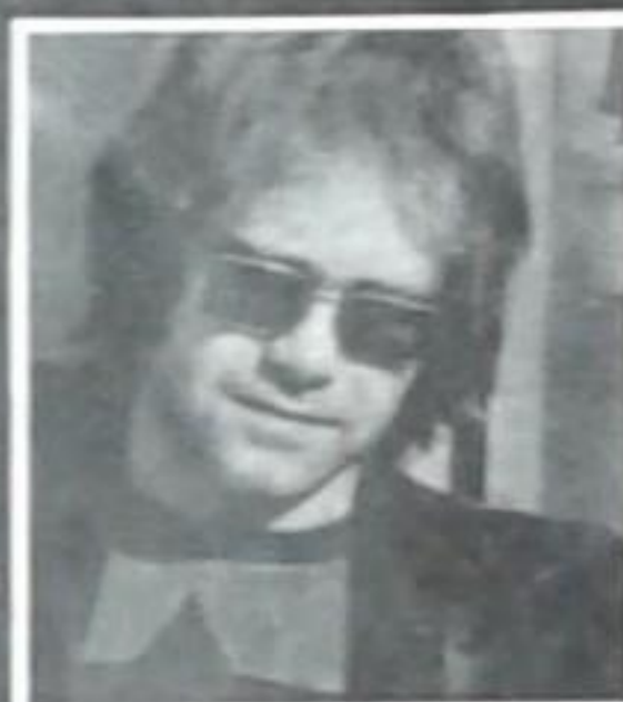
"La creación de mi propio sello es una forma de rebelión contra las grandes compañías de discos."

efectuó su primera gira inglesa. En esos mismos doce meses graba "Friends", una realización de Lewis Gilbert. Para la grabación están los mismos músicos que de costumbre. A saber: Paul Buckmaster en los arreglos, Elton en teclados, canto y composición; Bernie en los textos; Nigel Olsson en batería; Dee Murray en bajo, y Caleb Quaye en las guitarras.